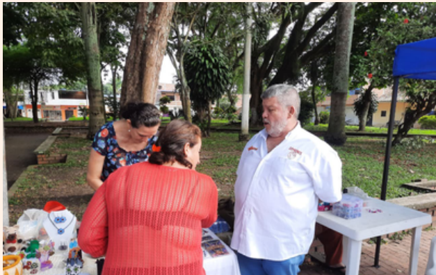
Acompañamos el mercado campesino, compartiendo un café, escuchando a la gente y recorriendo sus caminos.