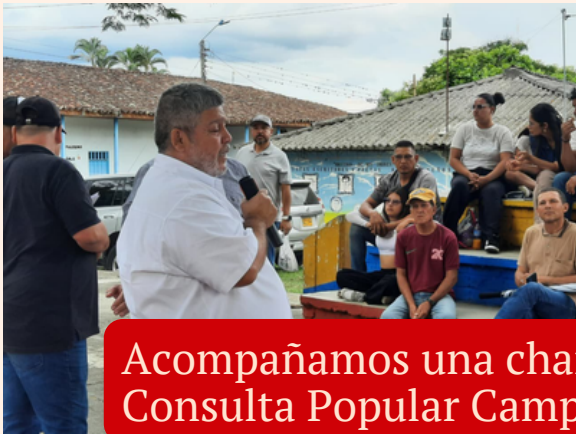
Acompañamos una charla sobre Consulta Popular Campesina